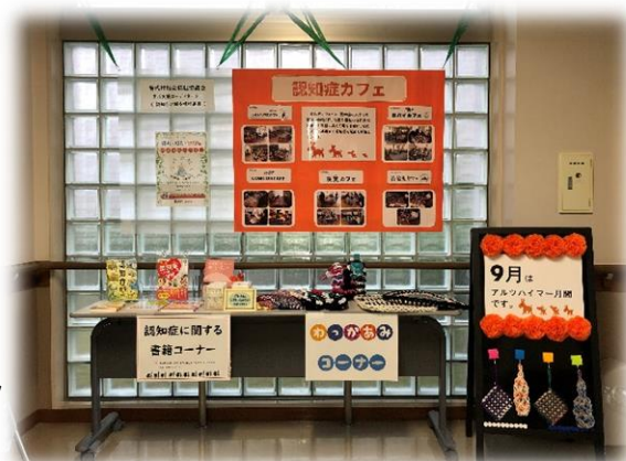
2022.9 アルツハイマー月間中の展示