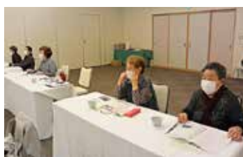
真剣な表情で講話を聞く会員

参加者からは「当時の状況を詳しく聞けて、とても有意義な研修会だった」とのお話がありました。