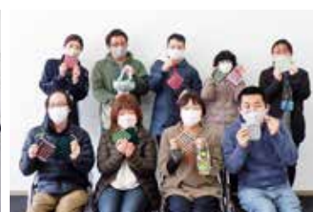
上手にできました!!