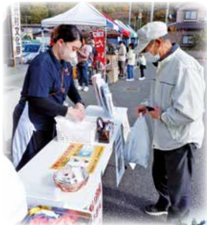
令和4年11月6日に開催された村文化祭にて赤い羽根募金活動を行いました。ご協力ありがとうございました。(関連記事 2ページ)