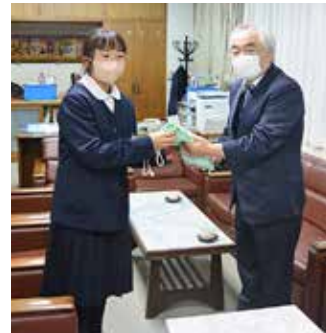
普代中学生徒会による募金伝達の様子