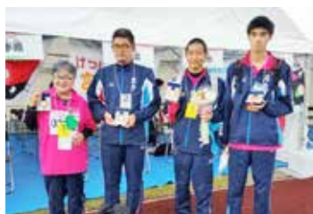
岩手県チームのみんなとメダル取ったよ!!

自主練習や県主催の強化練習など、日頃の成果を十分に発揮し、アキュラシーの部で見事一位を獲得しました。