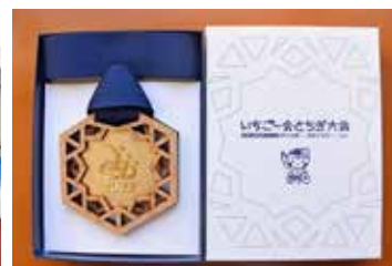
全国大会第1位のメダル!!