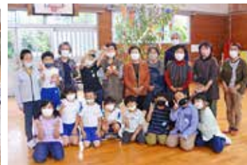
完成した七夕飾りの前でハイチーズ