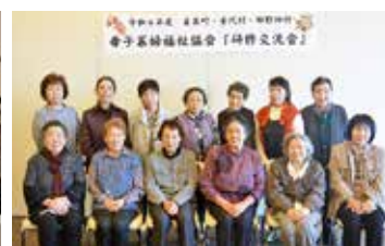
田野畑村、岩泉町母子協のみなさんと記念撮影