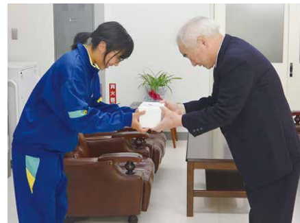
普代小児童会による募金伝達の様子